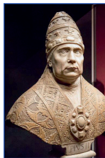
papež Pius II.