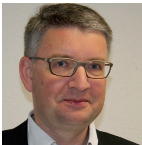
Mons. Dr. Peter Kohlgraf