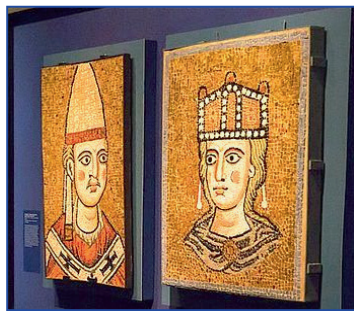
mozaika papeže a Církve