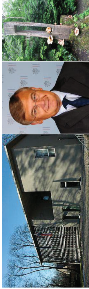
Foto: generální konzulát, Libelenstr.; konzul, umělecký pařez v zahradě

Neformální setkání pokračovalo rozhovory a krásně připraveným pohoštěním.