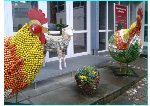
Vzkříšení v klášteře Schäflarn (Oberbayern) - výstava malovaných vajec - Oberstadion (Oberschwaben)