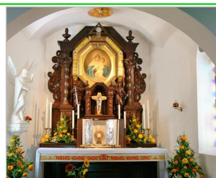
milostná kaple v Ergenzingen

14 30 hodin Mariánská pobožnost v milostné kapli