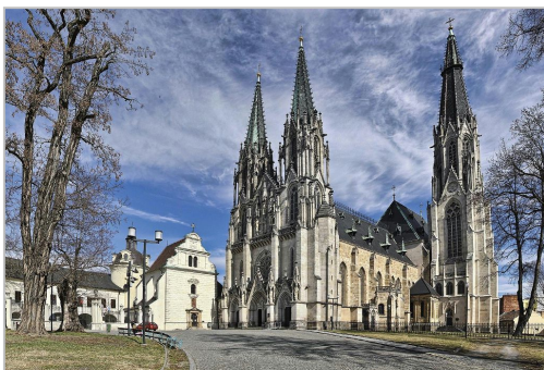
olomoucká katedrála sv. Václava